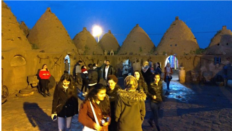
Hatay Mustafa Kemal Üniversitesi Mimarlık Fakültesi Mimarlık Bölümü öğrencileri ve öğretim elemanları Harran, Şanlıurfa, 14 Mart 2019