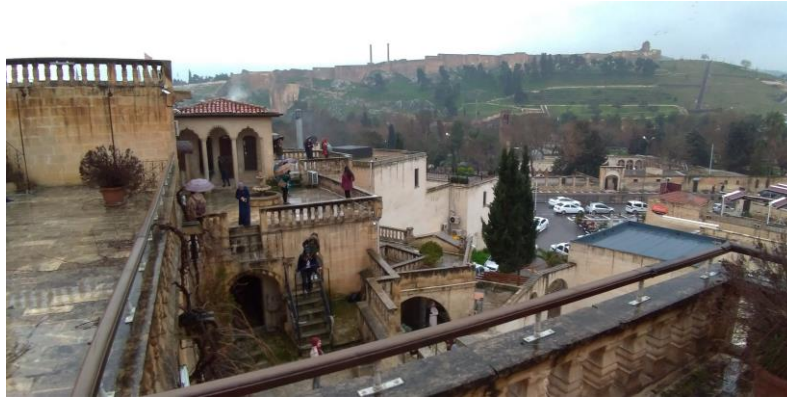
Hatay Mustafa Kemal Üniversitesi Mimarlık Fakültesi Mimarlık Bölümü öğrencileri ve öğretim elemanları Şanlıurfa tarihi kent merkezinde (Balıklıgöl ve kent merkezindeki avlulu evler), 14 Mart 2019