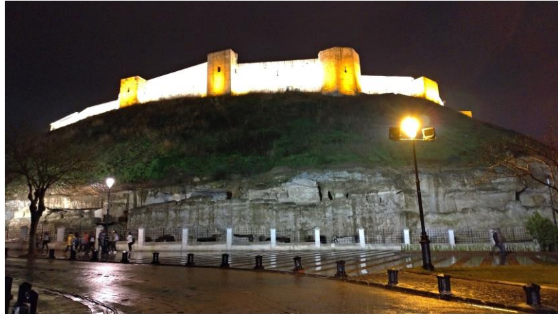
Gaziantep Kalesi, 15 Mart 2019