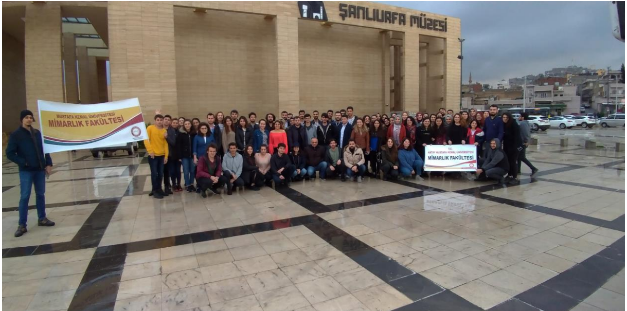
Hatay Mustafa Kemal Üniversitesi Mimarlık Fakültesi Mimarlık Bölümü öğrencileri ve öğretim elemanları Şanlıurfa Müzesi'nde, 14 Mart 2019