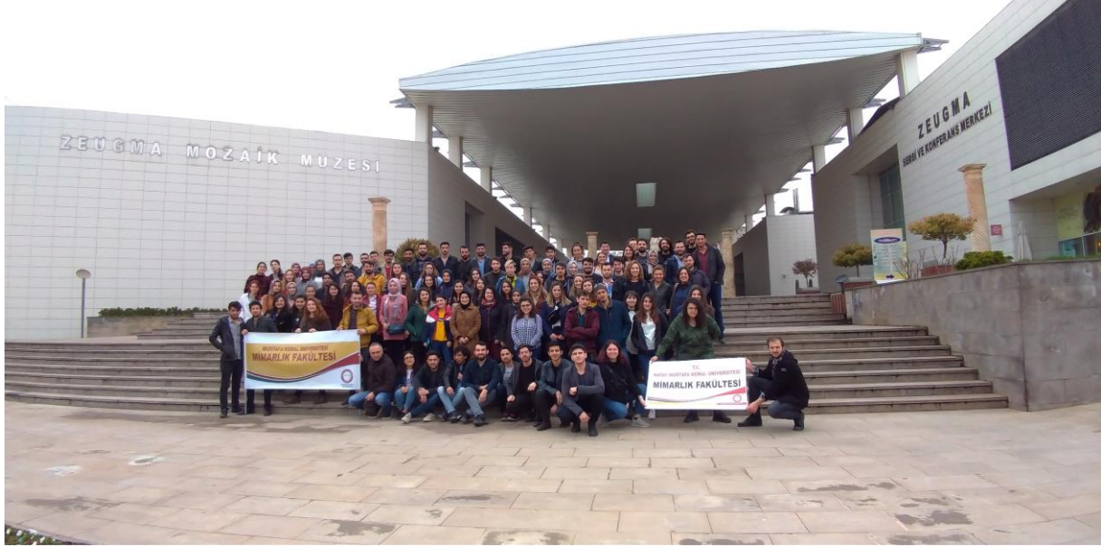
Hatay Mustafa Kemal Üniversitesi Mimarlık Fakültesi Mimarlık Bölümü öğrencileri ve öğretim elemanları Zeugma Mozaik Müzesi, Sergi ve Konferans Merkezi, Gaziantep, 15 Mart 2019

15 Mart 2019 sabahı Gaziantep Müze Kompleksi (Zeugma Müzesi) gezilerek tarihi kent merkezine dönülmüş, Gaziantep kalesi, Hışvahan ve diğer hanlar, müzeler, Bakırcılar çarşısı, Elmacı pazarı, tarihi Tahmis Kahvesi, UNESCO Dünya Miras geçici listesine alınmış olan Livas ve Kasteller (kent su yolları ve sistemi) gezilerek akşam Antakya, Hatay'a dönülmüştür.