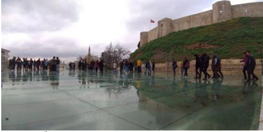
Hatay Mustafa Kemal Üniversitesi Mimarlık Fakültesi Mimarlık Bölümü öğrencileri ve öğretim elemanları Gaziantep Kalesi, 15 Mart 2019