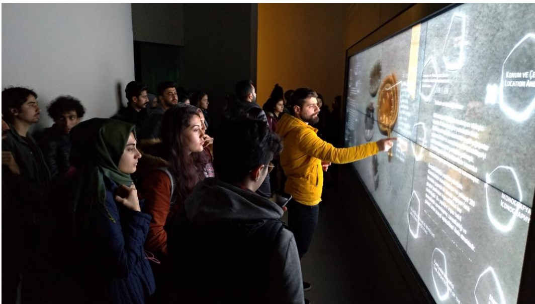
Hatay Mustafa Kemal Üniversitesi Mimarlık Fakültesi Mimarlık Bölümü öğrencileri ve öğretim elemanları Göbeklitepe arkeolojik alan ve ziyaretçi merkezinde, 14 Mart 2019

14-15 Mart 2019'da düzenlenen teknik gezimiz kapsamında öğrencilerin bu dönem mimari tasarım ve ilişkili dersler kapsamında Antakya tarihi kent merkezinde üzerine çalışmakta oldukları Antakya Gastronomi Akademisi ve Hatay Mimarlık Merkezi projelerine örnek oluşturabilecek yeni mimarlık uygulamalarının ve tarihi, kültürel bağlamda yakın coğrafyadaki çevrelerin gezilerek tanınması; tarihi-kültürel verilerin günümüz modern mimari uygulamalarına etkisinin ve tarihi kent merkezlerindeki mimari yapı-yakın çevre tipolojilerinin üzerine alan çalışmaları, kent ve doğal çevrede yer, mimari yapı tasarım-üretim süreçlerinde ekolojik denge unsurlarının yerinde incelenmesi yoluyla bilgi ve görgünün, ve dolayısıyla, eğitim-öğretimin kalitesinin artırılması amaçlanmıştır.