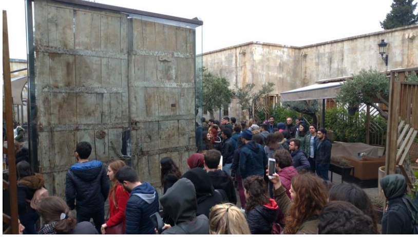
Hatay Mustafa Kemal Üniversitesi Mimarlık Fakültesi Mimarlık Bölümü öğrencileri ve öğretim elemanları Hışvahan, Gaziantep, 15 Mart 2019